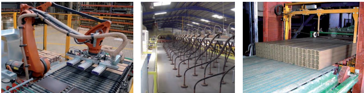
Deben propiciarse los más altos estándares de tecnificación de la industria (imágenes tomadas de Técnica Cerámica N° 400)